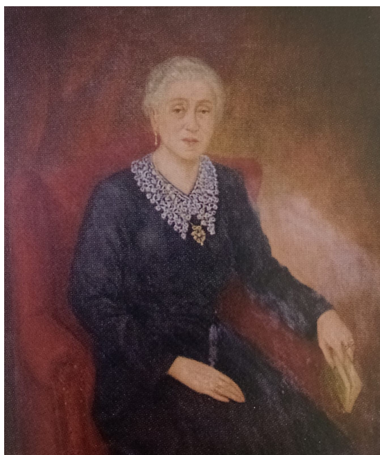
Imagen disponible en Loyola, Verona (2018). Guía Patrimonial Cementerio General de Concepción: Circuito Personajes y Familias Históricas . Concepción, Chile: Trama Impresores, p.33.

Desde muy temprano sintió el llamado de la vocación, dedicando todo su esfuerzo y fortuna a la enseñanza. En una época marcada por las diferencias sociales, ella veló por entregar a las mujeres educación e instrucción, fundando en 1896 el Liceo de Señoritas “Santa Filomena”, en su antigua casa familiar ubicada en calle Freire esquina de Serrano.