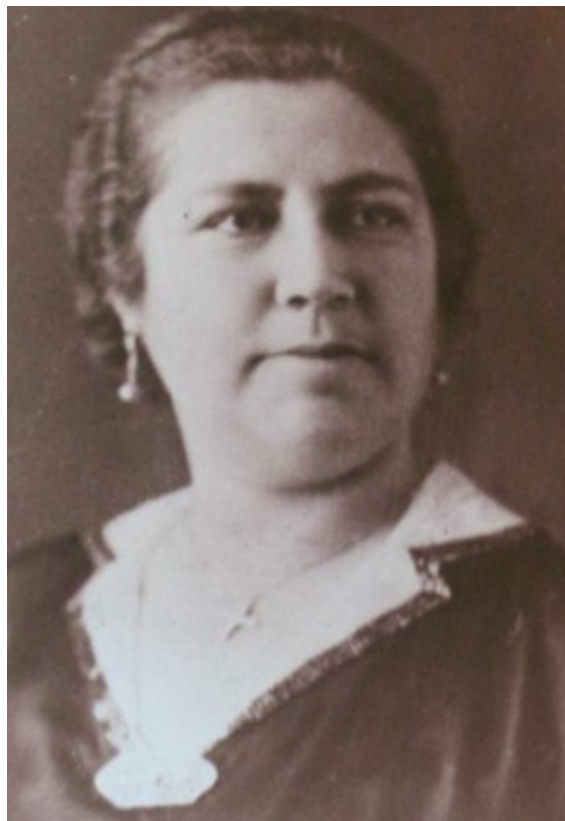
Imagen disponible en sitio web https://www.cementerioconcepcion.cl/circuito-mujeres-con-historia/