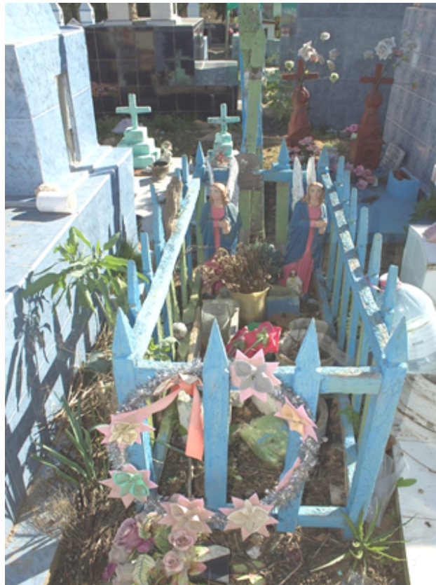
Sepulturas en tierra de la primera época del cementerio. 1906 – 1940, autoría propia, 2016.