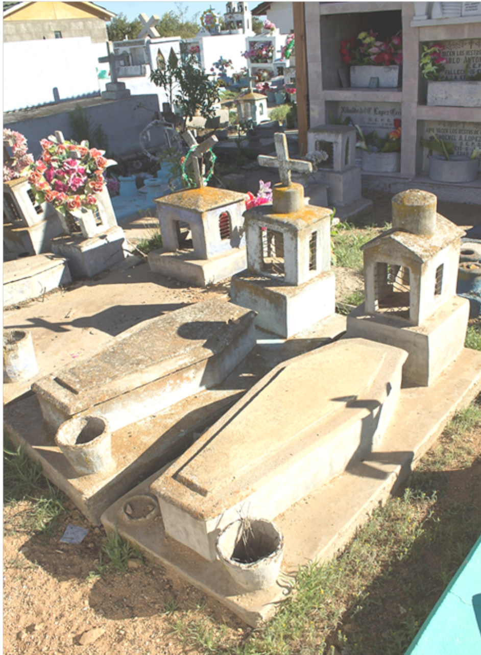
Tumbas con forma de ataúd, 2016.

iglesias en la cabecera. Este tipo de sepultura era conocido por la gente del pueblo con el nombre de tapados.