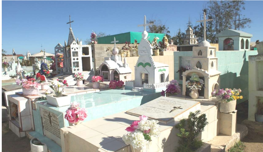
Sepulturas de Cerrillos de Tamaya, con réplicas de iglesias, 2016