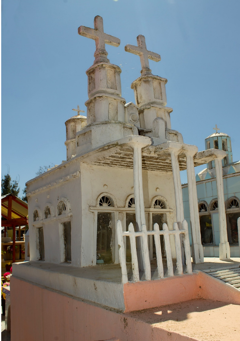
Basílica de Andacollo, 2016