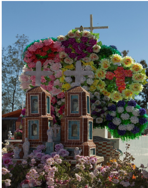
Iglesia construida por Arnaldo Rivera Lazo, autoría propia, 2016

Construyó dos de ellas una Iglesia de Andacollo, en la tumba de la familia Villegas recubierta con miriglasch (azulejo en miniatura). Se distingue de las demás por su porte y su cúpula de cemento y la que existe sobre la tumba de su abuelo 11 .