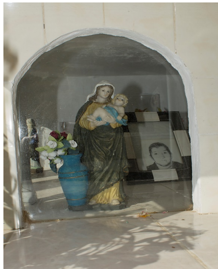
Detalle en tumba de Cerrillos de Tamaya, 2016

A partir de 1950 el maestro Juan Lazo se dedicó a construir nichos de cemento y sobre su superficie instaló réplicas de iglesias que en su interior los deudos decoraban con santos, floreritos, juguetes si eran tumbas de angelitos y una multiplicidad de objetos decorativos, devocionales y afectivos.