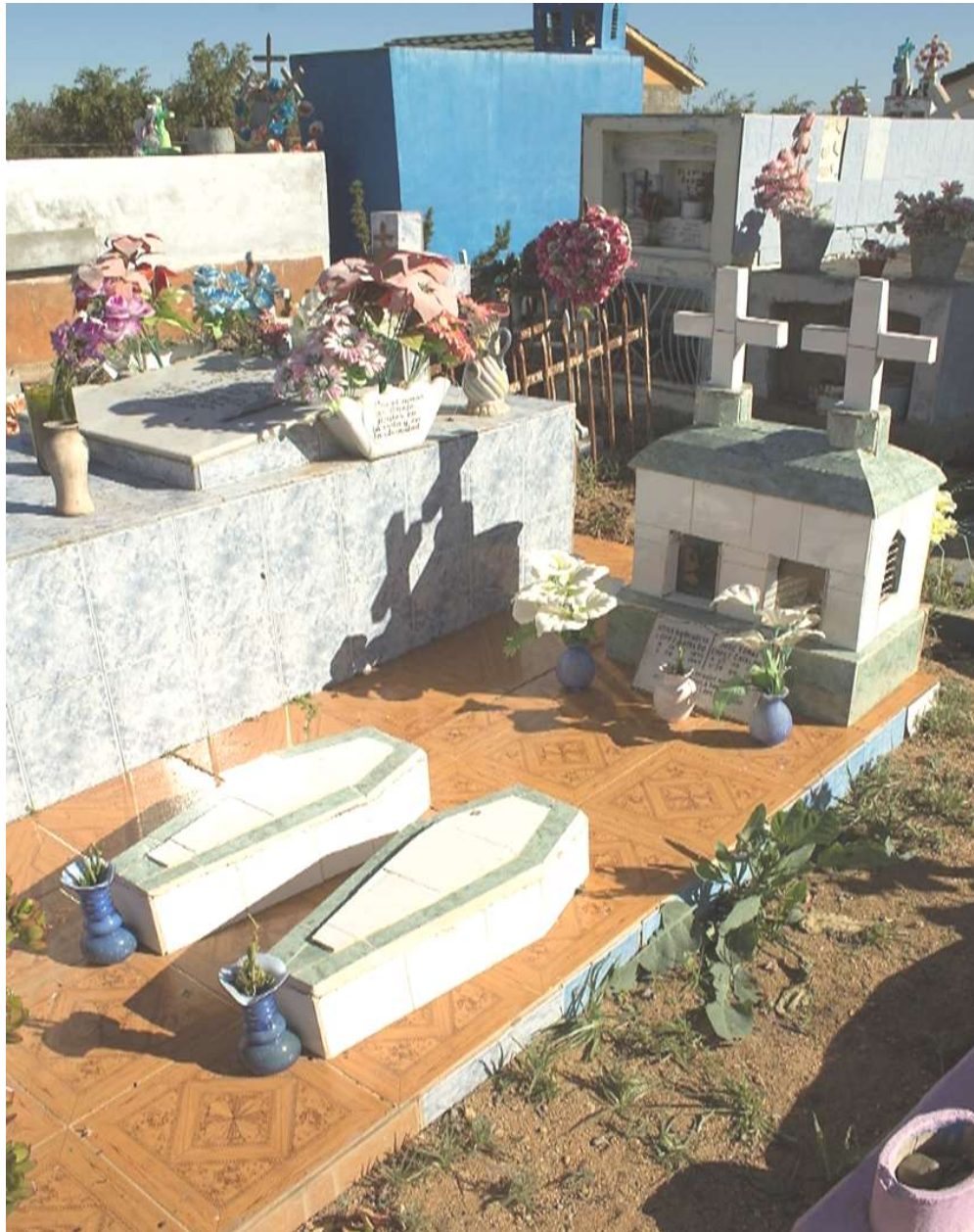
Vista parcial del cementerio de Cerrillos de Tamaya, 2016