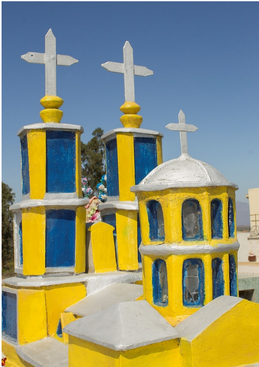
Réplica Basílica de Andacollo con los colores de 1970. Juan Lazo Tapia