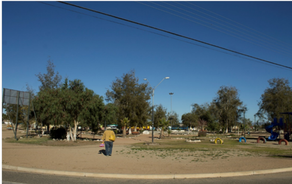
Plaza de Cerrillos de Tamaya, 2016

Después del cese de la actividad minera, poblados como El Oro, donde vivía una parte de los trabajadores del mineral de Tamaya, se trasladaron a Cerrillos e igualmente el registro civil.