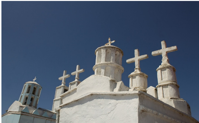
Detalle de la Basílica de Andacollo, fotografía 2016, de autoría propia

Las iglesias eran hechas de cemento y pintadas con óleos comerciales, predominando el plateado, el verde Nilo. Los ocre y rosados. En tanto la basílica de Andacollo estaba pintada con los colores amarillo y azul.