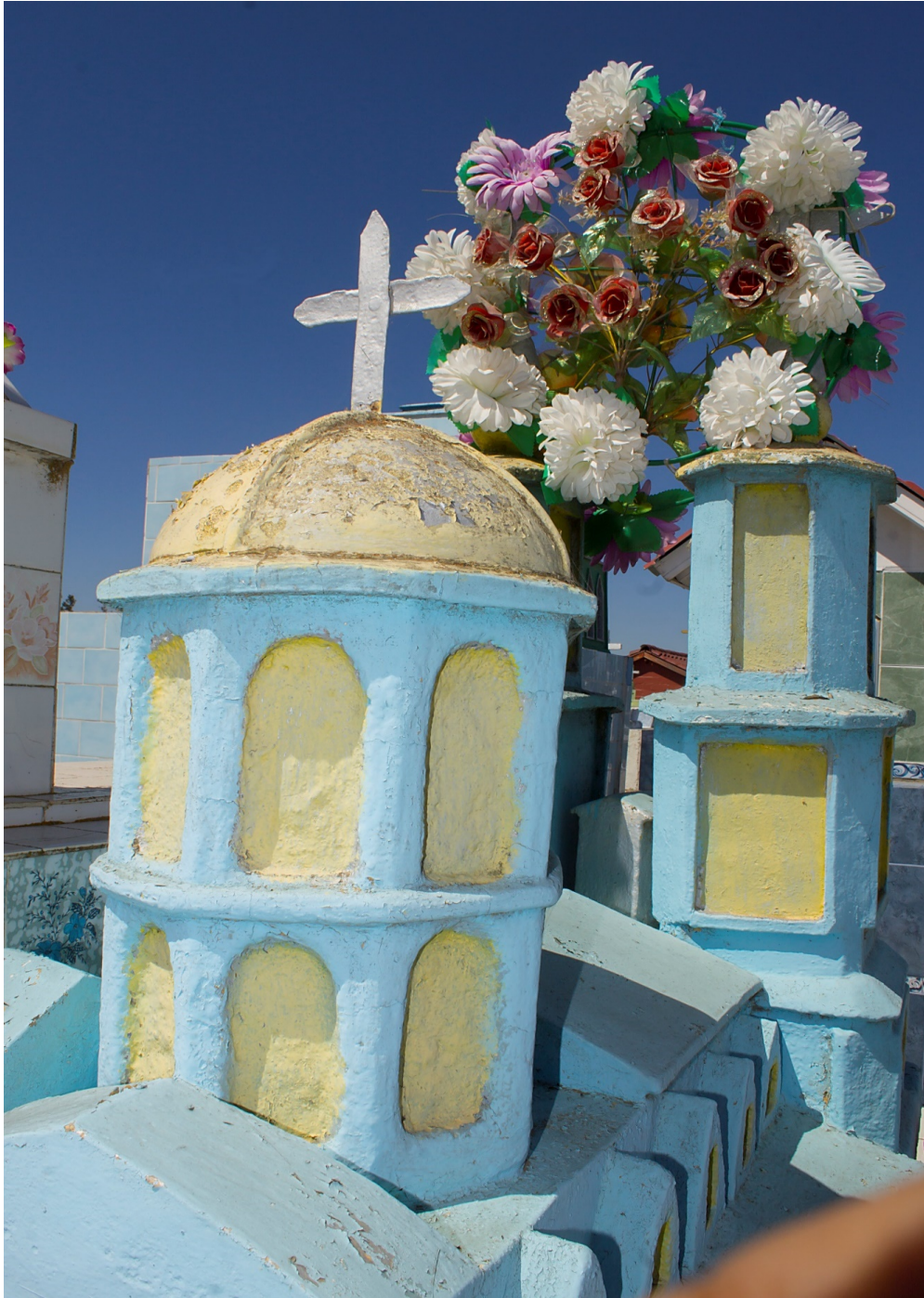
Detalle de cúpula de Iglesia de Andacollo, autoría propia, 2016