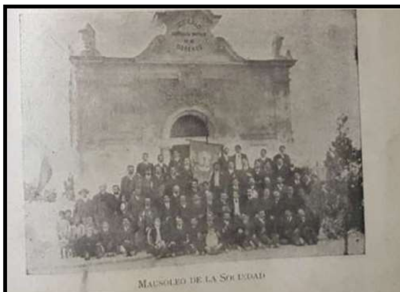
Imagen 1: Mausoleo de la Sociedad de Socorros Mutuos de Obreros de Concepción, actual Sociedad Mutualista Lorenzo Arenas.

Incluso, entre los espacios sociales que las mutualidades fueron conformando en la ciudad en beneficio de sus asociados, fue común que construyeran su propio mausoleo en el cementerio de Concepción. En la fotografía siguiente podemos observar el mausoleo de la Sociedad Mutualista Lorenzo Arenas en el año 1910.