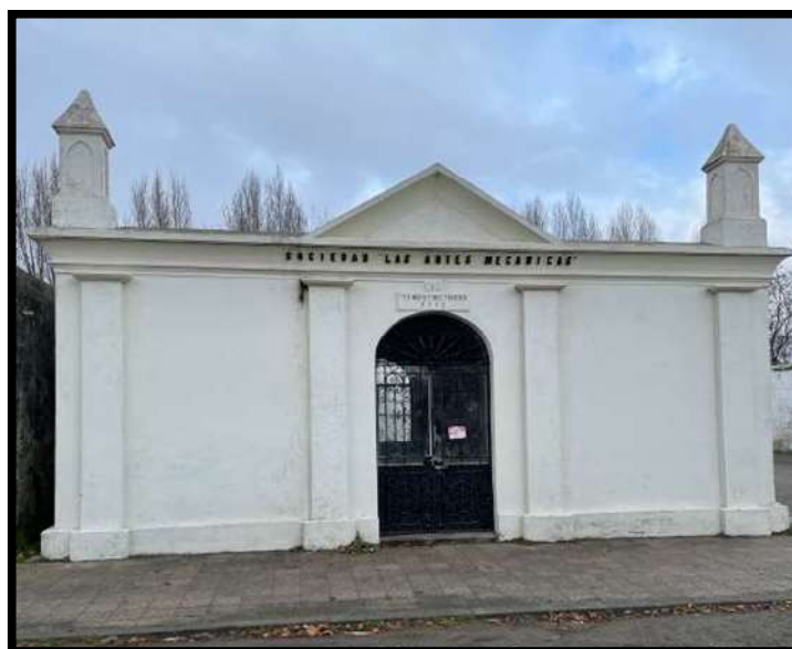
Imagen 3: Actual Mausoleo de la Sociedad “Las Artes Mecánicas”. Cementerio General de Concepción.