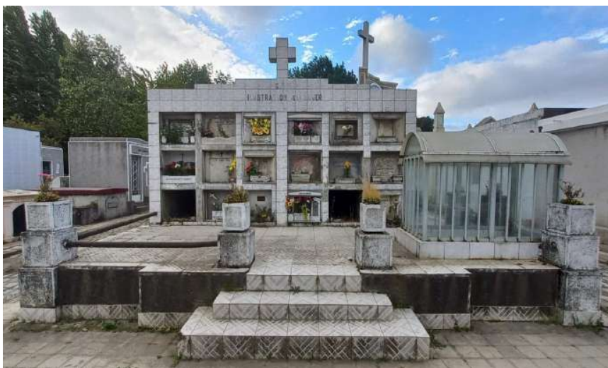
Imagen 5: Actual Mausoleo de la Sociedad S.M. “Ilustración de la Mujer”. Cementerio General de Concepción.