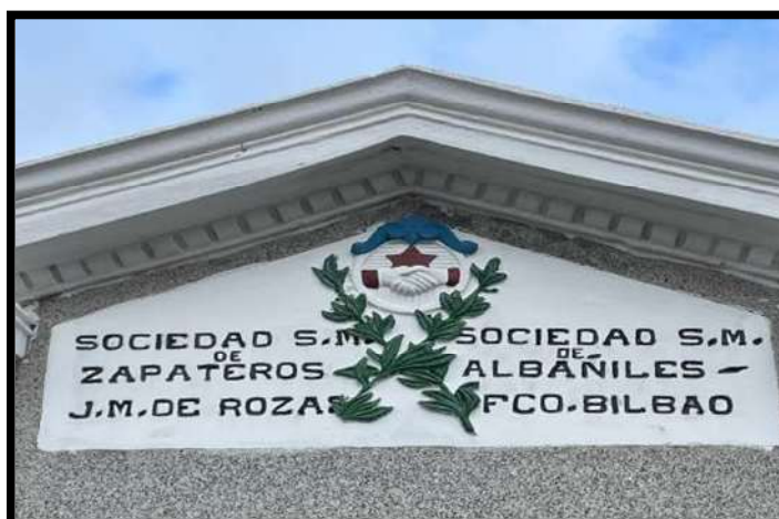
Imagen 4: Actual Mausoleo de la Sociedad S.M. de Zapateros J.M De Rozas y Sociedad S.M. De Albañiles FCO. Bilbao. Cementerio General de Concepción.