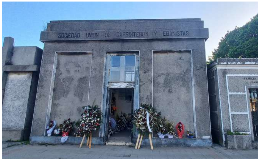
Imagen 6: Actual Mausoleo de la Sociedad Unión de Carpinteros y Ebanista. Cementerio General de Concepción.