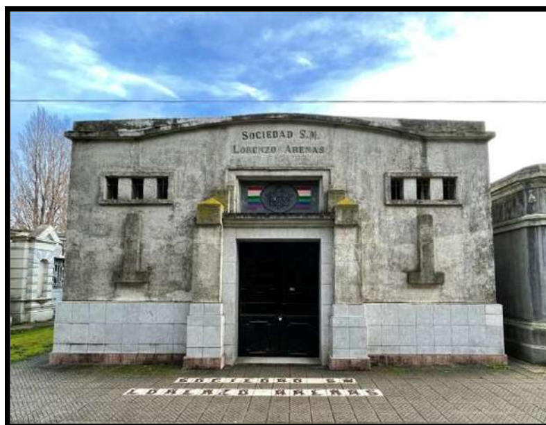
Imagen 2: Actual Mausoleo de la Sociedad de Socorros Mutuos Lorenzo Arenas. Cementerio General de Concepción.