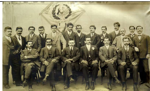
GREMIO DE EMPAQUETADORES DE COMERCIO. Fuente de imagen:

Contexto Social: Al comenzar el siglo XX los trabajadores no tenían ningún tipo de legislación social o laboral que brindara protección o les favoreciera de alguna manera. Fueron ellos mismos quienes a través de mutuales y sociedades se organizaron para proteger a sus asociados y fomentar la solidaridad proletaria.