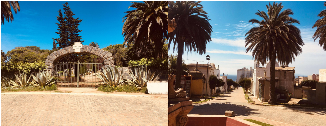
Entrada del Cuartel Alemán

Su distribución y tipos de sepultura es un reflejo de la ciudad y su sociedad cosmopolita, donde podemos observar, por ejemplo, el Cuartel alemán, lugar en el cual descansan los primeros inmigrantes de Valparaíso. Podemos mencionar también los nichos institucionales como el perteneciente a la Armada de Chile, institución que históricamente está unida a la ciudad, ya que fue en Valparaíso donde nació la Primera Escuadra, de sus cerros y quebradas surgieron sus tripulantes, se fundó y sigue funcionando la Escuela Naval.