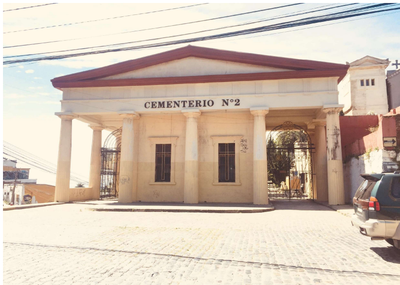
Fachada Cementerio N.º 2

La Ordenanza General de Salubridad se implementa en 1883 y el Reglamento General de Cementerios es dictado en 1970 y es administrado por el Servicio Nacional de salud, hasta 1980 donde se estableció que los cementerios pasaron a manos de los municipios y dejando de contar con presupuesto estatal, debiendo financiarse, lo cual abrió la posibilidad que los municipios crearán corporaciones (personalidades jurídicas con derecho privado) con esto, facilitar su administración algo más autónoma.