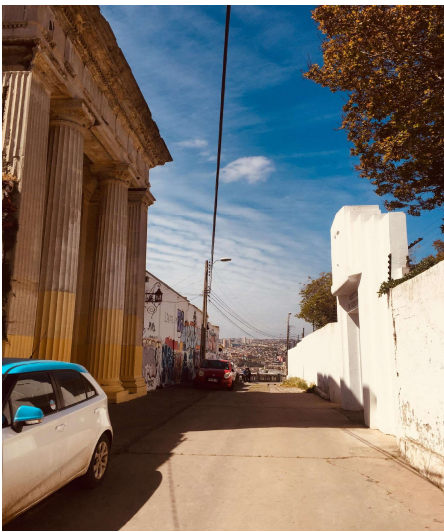
Calle que separa Cementerio N°1 y Disidentes