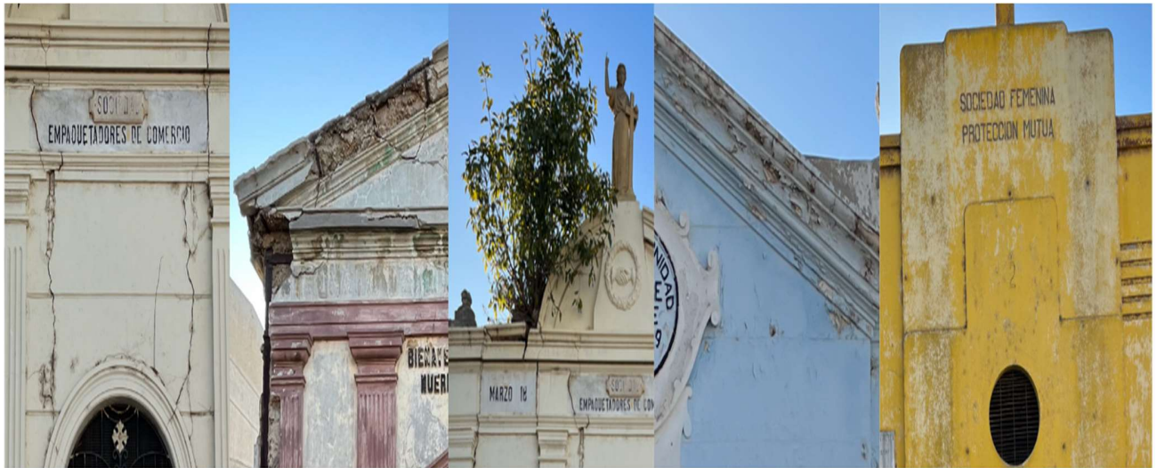
Daños en las fachadas de los mausoleos (de izq. a der.) Grietas, faltantes por carbonatación, desprendimiento de pintura y suciedad adherida.