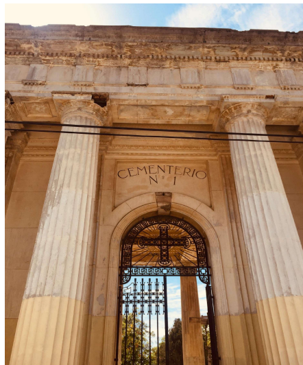
Fachada de Cementerio N°1