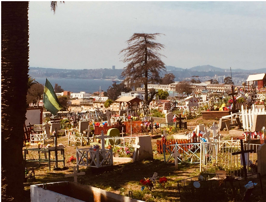
Vista al Pacífico desde el cementerio N°3

Casi al borde del acantilado y con una vista incomparable, en la cual se vislumbra el Faro Punta Ángeles y el océano Pacífico se levanta esta necrópolis con ventilación natural y a distancia prudente de las viviendas, velando así por la higiene de la ciudad, y considerando al igual que los cementerios del Cerro Panteón, su construcción en altura para evitar que deslizamientos o aluviones, curiosamente existen pocos casos similares de cementerios en alturas en el país.