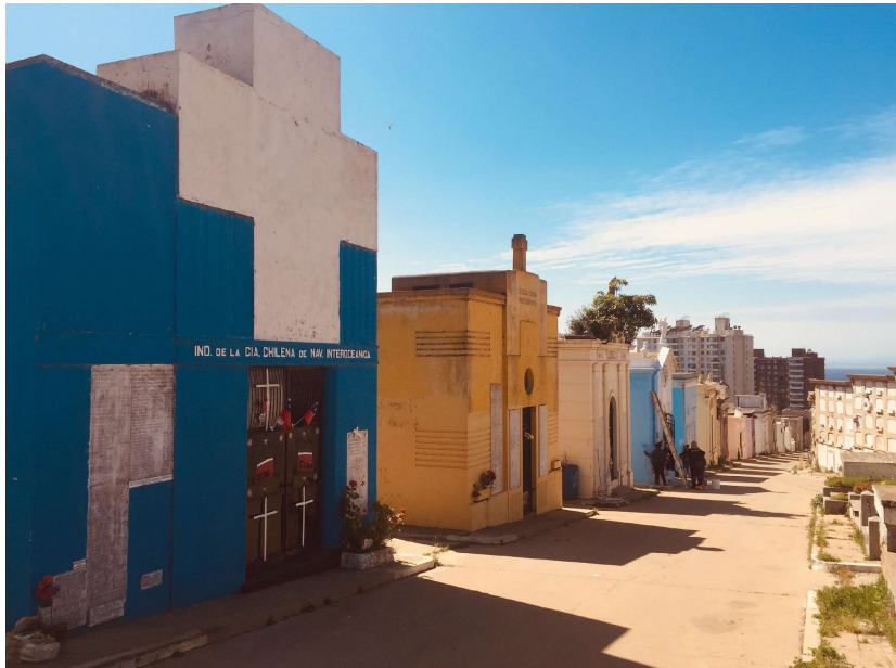
Mausoleos institucionales, sociedades y colectivos

En este periodo las sociedades mutualistas representan el férreo compromiso social existente en la época, el cual resguarda el bienestar comunitario y son un aspecto muy marcado en el Cementerio 3 de Playa Ancha, en el cual se destacan los vínculos con las artes y oficios.