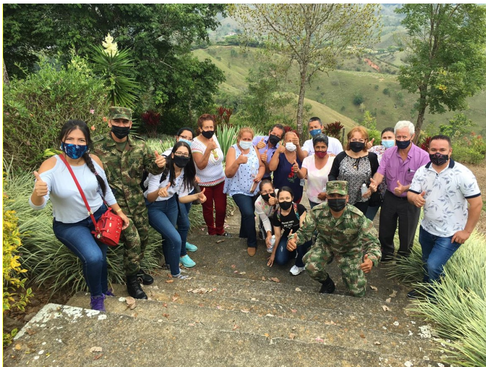
Miembros del Ejército Nacional de Colombia y de su Programa Fe en Colombia, en compañía de la comunidad de Yalí en medio del recorrido por las instalaciones del Parque Cementerio de Yalí.