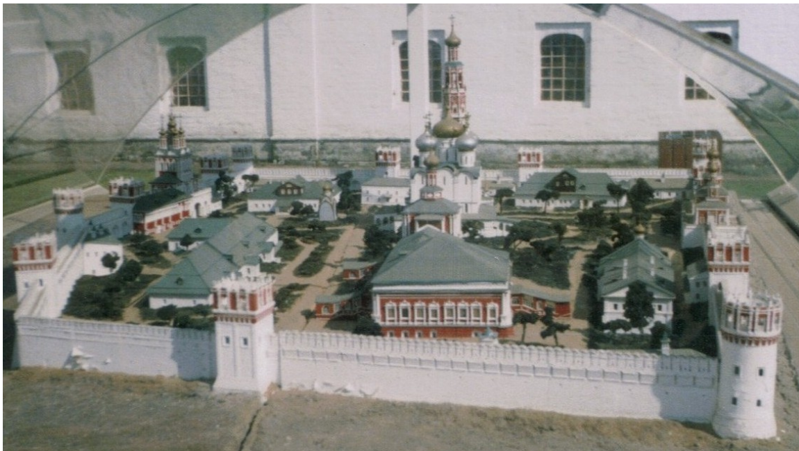
Maqueta del Monasterio y de su naciente cementerio, antes de su ampliación a partir de 1898.

Complementando la leyenda, se sabe que el convento Novodevichy, paralelamente a su función de hogar de las religiosas de clausura, sirvió de sitio de inhumación a los más distinguidos miembros de la nobleza moscovita a los que, sin embargo, sus abolengos no les eran suficientes para ser admitidos en el exclusivo círculo de los descendientes directos de los zares, cuyos cuerpos eran sepultados al interior de las catedrales del Kremlin. Trasladada la casa real a la nórdica San Petersburgo, en el siglo XVIII el convento abrió sus puertas a militares y burgueses que, por mérito o condición económica, pudieron reunirse entonces con la aristocracia moscovita a la que comenzaba a no irle tan bien.