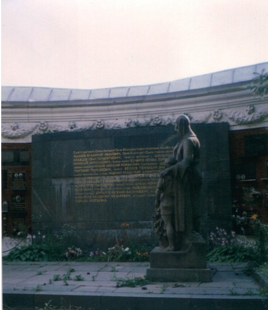
Monumento póstumo en homenaje a las víctimas de un accidente aéreo en 1964 en Yugoslavia. Foto: Cementerio Novodevichy Moscú - Diego A. Bernal B., 2003.

Una afligida madre abraza a su hijo mientras parece leer la lista de los oficiales muertos en un accidente aéreo ocurrido en Yugoslavia en 1964. Nadie modula. La fuerza de esas miradas llenas de bronce, mármol y tristeza transmiten la conmoción que esa catástrofe produjo en los familiares de las víctimas. Estamos en el Novodevichy. El cementerio museo más grande e importante de Moscú. Un campo santo donde lo escrito es suplementario.