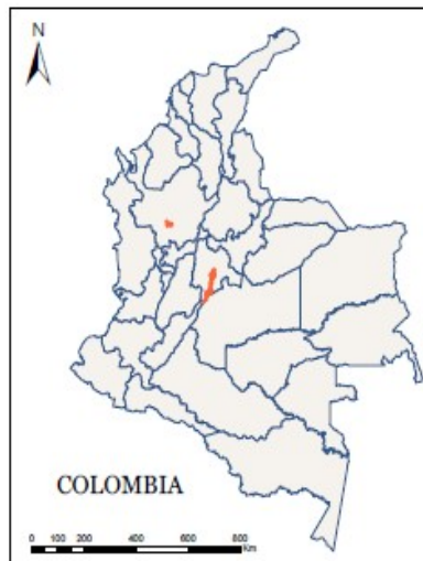
Figura 1. Mapa de Colombia con ubicación por departamentos

el comportamiento de las regiones, se consideraron todas las afirmaciones y se creó una matriz de transformación de componentes, que es un promedio de las correlaciones, se organizó el conjunto de respuestas como componentes versus respuestas con el fin de determinar cómo responden frente a las costumbres funerarias.